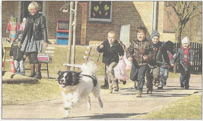
3. Platz: Therapiehunde-Brandenburg e. V.. Bilderklärung laut Einsender: Das Foto wurde in der Kita Netzen gemacht, dort haben wir immer mal wieder Treffen, bei denen wir den Kindern den richtigen Umgang mit Hunden beibringen. Hier rennt Tobi gerade „ehrenamtlich“ mit den Kindern um die Wette, um ihnen zu zeigen, dass man vor einem Hund nicht wegrennen kann, da der Hund immer schneller ist. Tobi steht hier stellvertretend für alle unsere im Verein Therapiehunde-Brandenburg tätigen Hunde und ihre Herrchen/Frauchen.